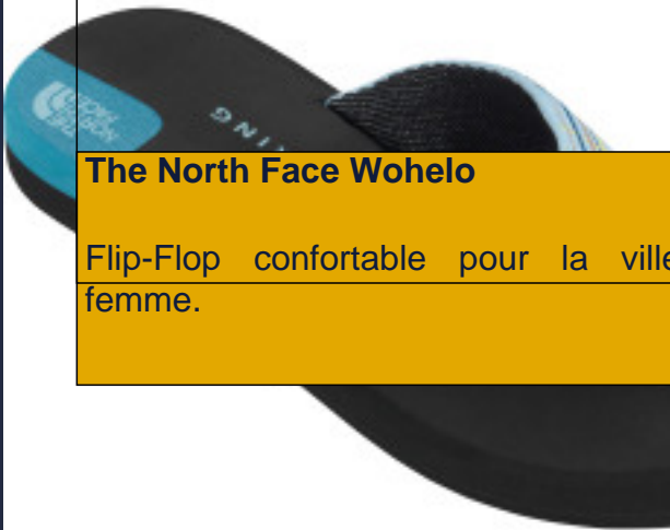
The North Face Wohelo

Flip-Flop confortable pour la ville femme.