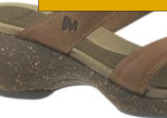
Merrell Siren Strap

Très bon confort pour toute la journée. Pour femme.